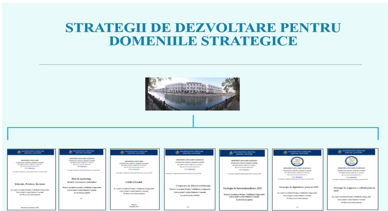
Fig. nr. 3: Strategiile de dezvoltare pentru domeniile strategice

Pentru fiecare domeniu strategic sunt elaborate strategii specifice de dezvoltare care să contribuie la implementarea și fundamentarea strategiei generale de dezvoltare a UCDC.